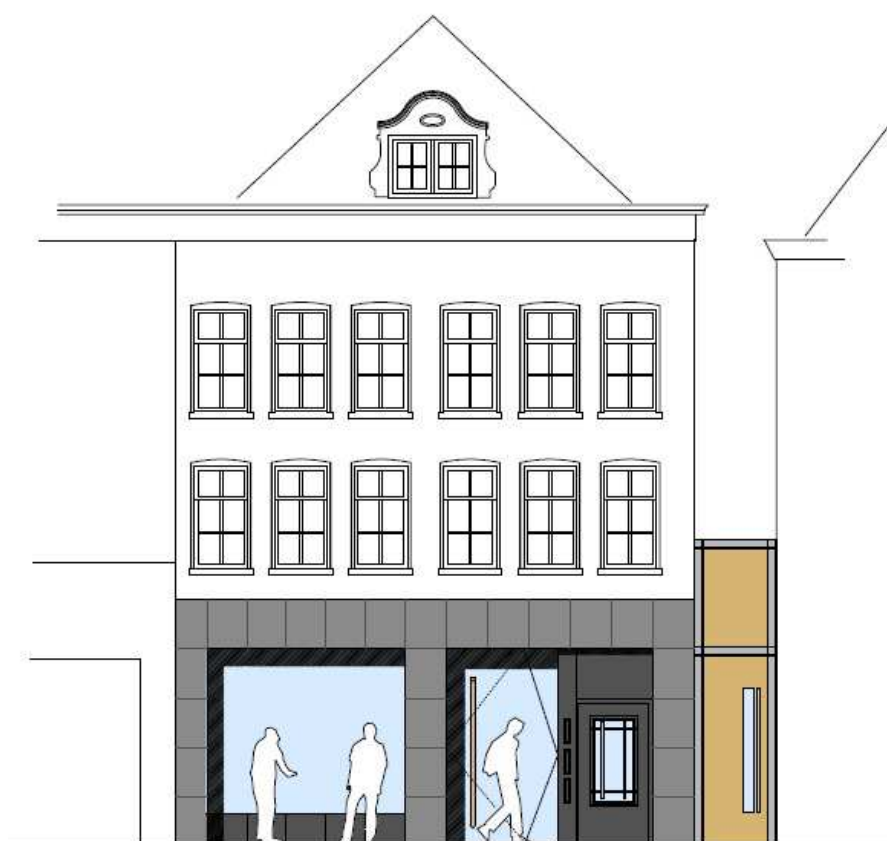
gevel oude vismarkt

Assiesstraat 2-C 8011 XT Zwolle Postbus 61 8000 AB Zwolle T: 038 - 423 71 11 info@mullerbog.nl www.mullerbog.nl Bank: NL04 RABO 0133 3815 79 BTW: NL8529.47.902 B.01 KvK: 58253483